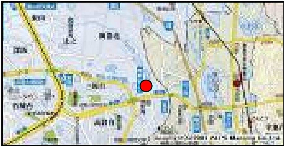
「ラブホテル〇〇」周辺広域地図